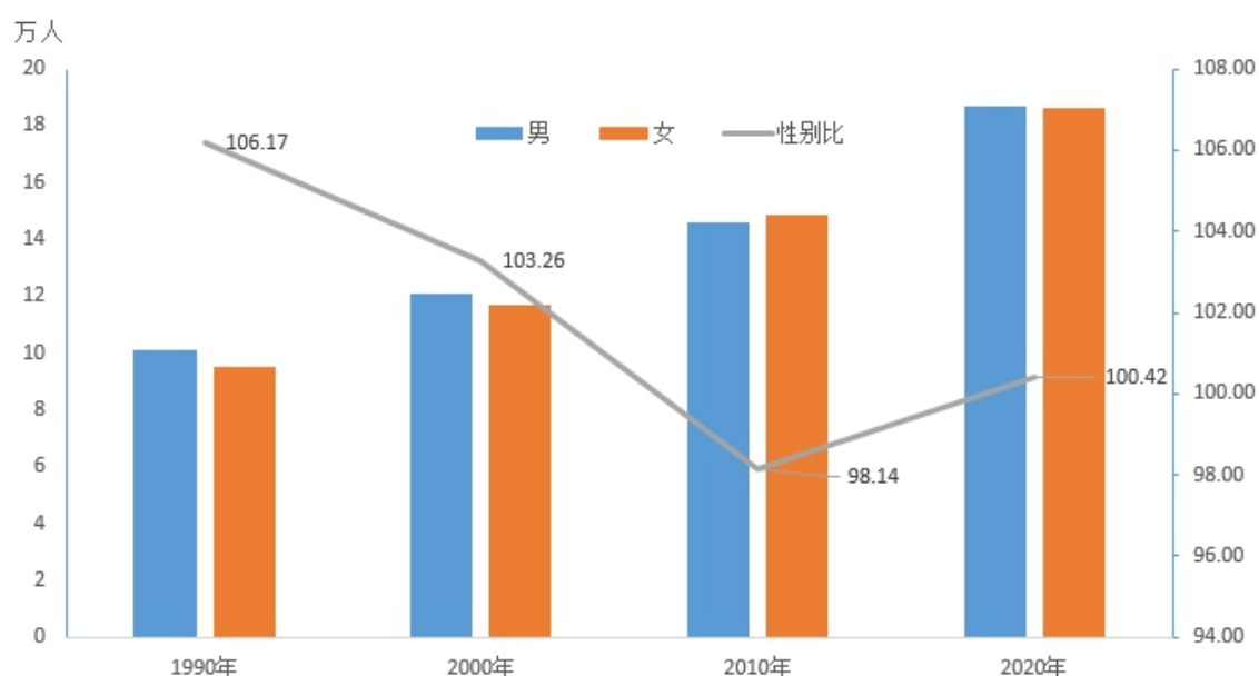
图 3-1 历次人口普查人口性别构成

全区常住人口 [2] 中，男性人口为187230人，占50.10%；女性人口为186456人，占49.90%。总人口性别比（以女性为100，男性对女性的比例）由2010年第六次全国人口普查的98.14上升为100.42。